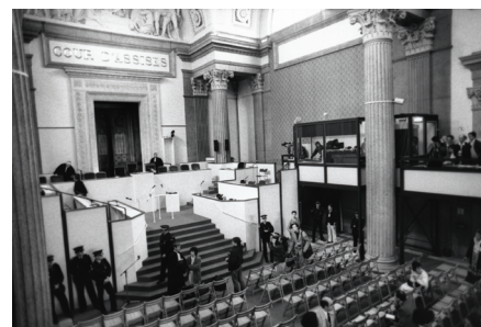
La salle d'audience des pas perdus du palais de justice de Lyon